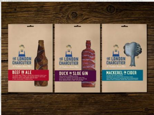
Рисунок 1. Линейка продуктов The London Charcutier

Английский производитель The London Charcutier выпустил линейку мясных и рыбных деликатесов в алкогольных напитках. Похожие продукты имелись на рынке Британии и ранее. Особое внимание к этой линейке вызвал совершенно уникальный и принципиально новый дизайн упаковки, разработанный по специальному заказу студией Designed by Good People Ltd. Оригинальная форма окна, обыгрывающая участие конкретного алкогольного напитка в составе, а также текст на ленте, подчеркивающий традиционность и натуральность обеспечили продуктам серии популярность среди потребителей практически с первого дня выпуска.