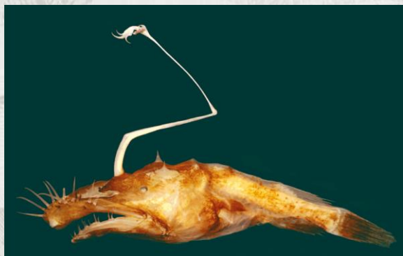
Рисунок 1. Новый вид рыбы в Мексиканском заливе

Ученые обнаружили новый вид рыбы в Мексиканском заливе на глубине около 1-1,5 км. Новый вид был назван Lasiognathus dinema . Особи оказались очень маленькими – от 3 до 9,5 см. в длину. Рыбу отнесли к разновидности морского чёрта. В настоящий момент образцы переданы в ихтиологическую коллекцию университета Вашингтона, которая является крупнейшей в мире коллекцией разновидностей глубоководного морского чёрта.