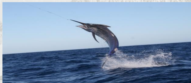
Рисунок 1. Гигантский голубой марлин.

Рыбак из Дании поймал голубого марлина весом 488 килограммов. Атлантические голубые марлины ведут одиночный образ жизни и не являются объектом промысла. Чтобы выудить марлина рыбаку потребовалось 3 часа. Вес самого крупного за всю историю пойманного марлина составлял 636 кг.