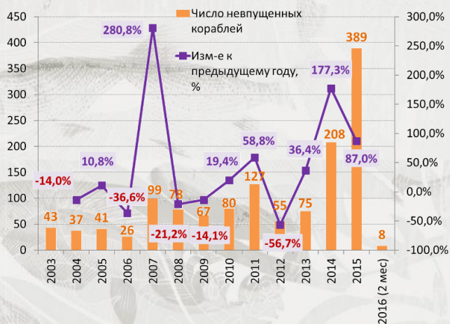
График 2. Число заблокированных на ввоз в США кораблей с креветками 2003-2016 (2 мес)

За 2 месяца 2016 года американское Управление по надзору за качеством пищевых продуктов и медикаментов (FDA) заблокировала только 8 импортных кораблей с креветками, что существенно ниже уровня 2014 и 2015 года. За последние 2 года количество заблокированных кораблей возросло на 418,7% из-за усиления контроля содержания запрещенных антибиотиков в поступающих морепродуктах и роста поставок из Малайзии, которые чаще всего и оказываются заблокированными. В 2016 году креветки из Малайзии в США практически не поставлялись, из 8 заблокированных кораблей 6 приходится на Индию. В 2015 году из Индии было остановлено 34 корабля (столько же, сколько за последние 13 лет), и в этом году ожидается продолжение данной тенденции.